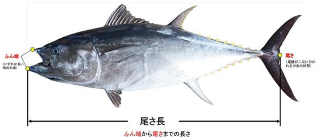
尾さ長の計測方法

※届出をせずにクロマグロを採捕したことが確認された場合、農林水産大臣から広域漁業調整委員会指示に従うべき旨の命令が発出されます。この命令に従わない場合には、漁業法第191条に基づき、罰則（1年以下の拘禁刑又は50万円以下の罰金）が適用されます。